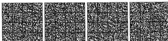
Tabella V.9-2: Compartimentazione